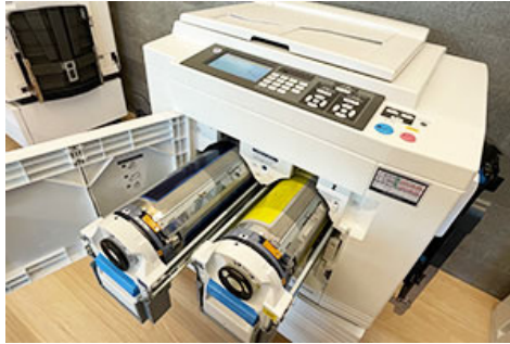
リソグラフ印刷機