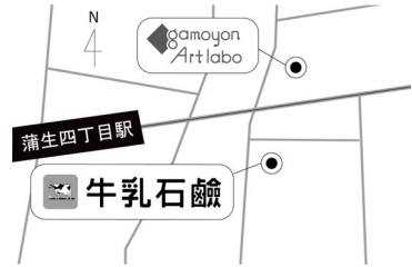
徒歩2分ほどのご近所さん