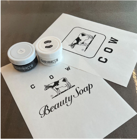
牛乳石鹸企業ロゴ