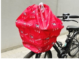
ひったくり防止カバー

牛乳石鹼は「良き企業市民」でありたいと考え、本社がある城東区や工場がある鶴見区で「ひったくり防止カバー」の配布や、小学校での手洗い授業の実施、地元企業との協業など地域社会への取組みを行ってきました。今回の協業は東信洋紙・牛乳石鹼ともに地域活性化を目指していることと、お互いの会社が徒歩2分の距離にあることがきっかけで実現。イベントではモノを手作りする楽しさを是非体験ください。