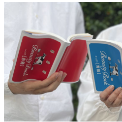
地元企業との協業企画