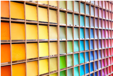
ペーパーギャラリー

約400種類の紙を「見て、さわって、感じる」ことができるペーパーギャラリーや、アナログ感とあたたかみのある仕上がりが特徴の孔版印刷機「リソグラフ」、誰でも簡単に手ぶらで遊べる「シルクスクリーン」で、ゆっくりとものづくりを楽しめます。