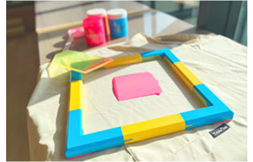
シルクスクリーン印刷